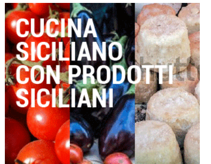
CUCINA SICILIANO CON PRODOTTI SICILIANI