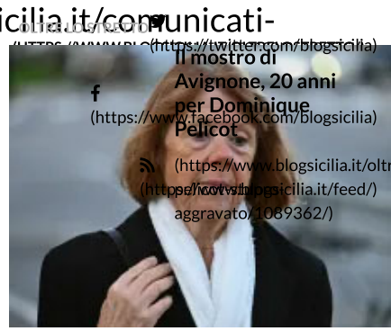
Avignone, 20 anni per Dominique Pelicot

La Capitaneria di porto, ricevuta la segnalazione, disponeva l'uscita di una motovedetta SAR con a bordo un soccorritore marittimo. Contestualmente, al Comando provinciale dei Vigili del fuoco veniva richiesto l'intervento di un mezzo navale antincendio e quello del nucleo sommozzatori sopraggiunto con una moto d'acqua per cooperare nelle operazioni di recupero dei naufraghi e per la ricerca subacquea di eventuali dispersi. Veniva, inoltre, richiesto