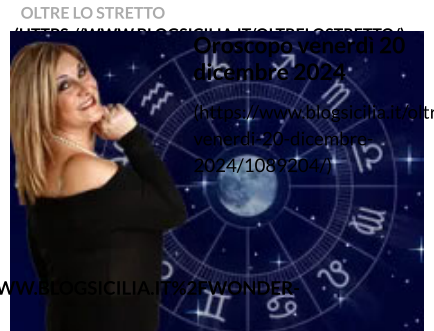
Oroscopo venerdì 20 dicembre 2024