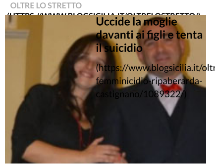
Uccide la moglie davanti ai figli e tenta il suicidio